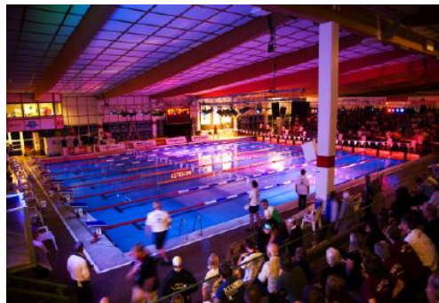
Rosenlundsbadet vid SM tävlingar i simning.

Föreningens medlemmar bidrager med c:a 5.000 timmars ideell arbetsinsats/ år för att det skall vara möjligt att genomföra dessa arrangemang.