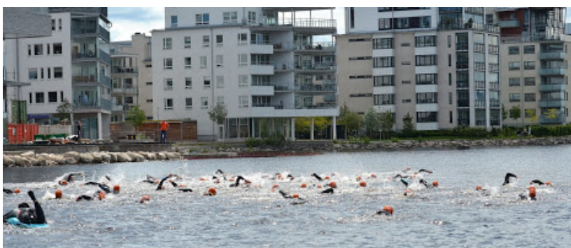
Jönköping Open Water avgörs i Munksjön med start och mål vid Bauers brygga