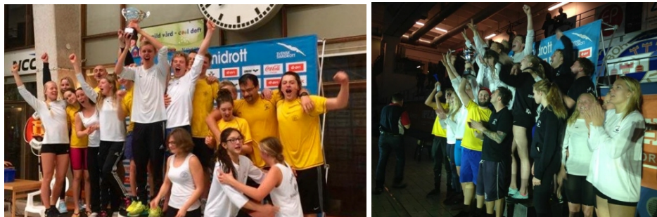
Glädjebubbel när JSS blev bästa förening på JSM (25 m) vid SM/JSM i Helsingborg och Sum-Sim (25m) vid sum-sims riksfinal i Göteborg

I dag har JSS ca 300 aktiva tävlingsidrottare i de fyra disciplinerna simning, simhopp, konstsim och livräddning. Jönköpings Simsällskap har som målsättning att varje år tillhöra landets topp 10 föreningar på ungdoms- junior- och senior nivå i de fyra idrotterna, som finns i föreningen. JSS driver Sveriges bästa simidrottsgymnasium i samarbete med Jönköpings kommun/Sandagymnasiet i Huskvarna.