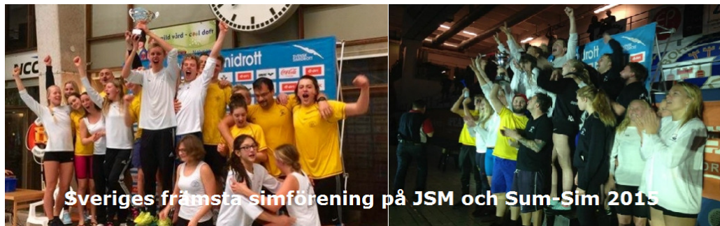
Sveriges främsta simförening på JSM och Sum-Sim 2015